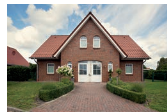
Ferienhaus in Hinte